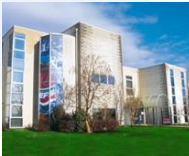
Printmateria: sede aziendale

“Sicuramente la conoscenza dei materiali e la consapevolezza del loro utilizzo. La versatilità del servizio offerto non pone limiti all'applicazione della stampa su ogni tipo di supporto. E' possibile stampare su materiali di diversa consistenza e composizione come rigidi, morbidi, cartone, vetro, plastica ed offrire un supporto tecnico attivo pronto a studiare insieme al cliente la soluzione ottimale”.