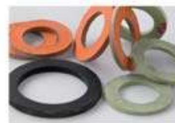
ARAMIDICI GIUNTURE (SENZA AMIANTO)