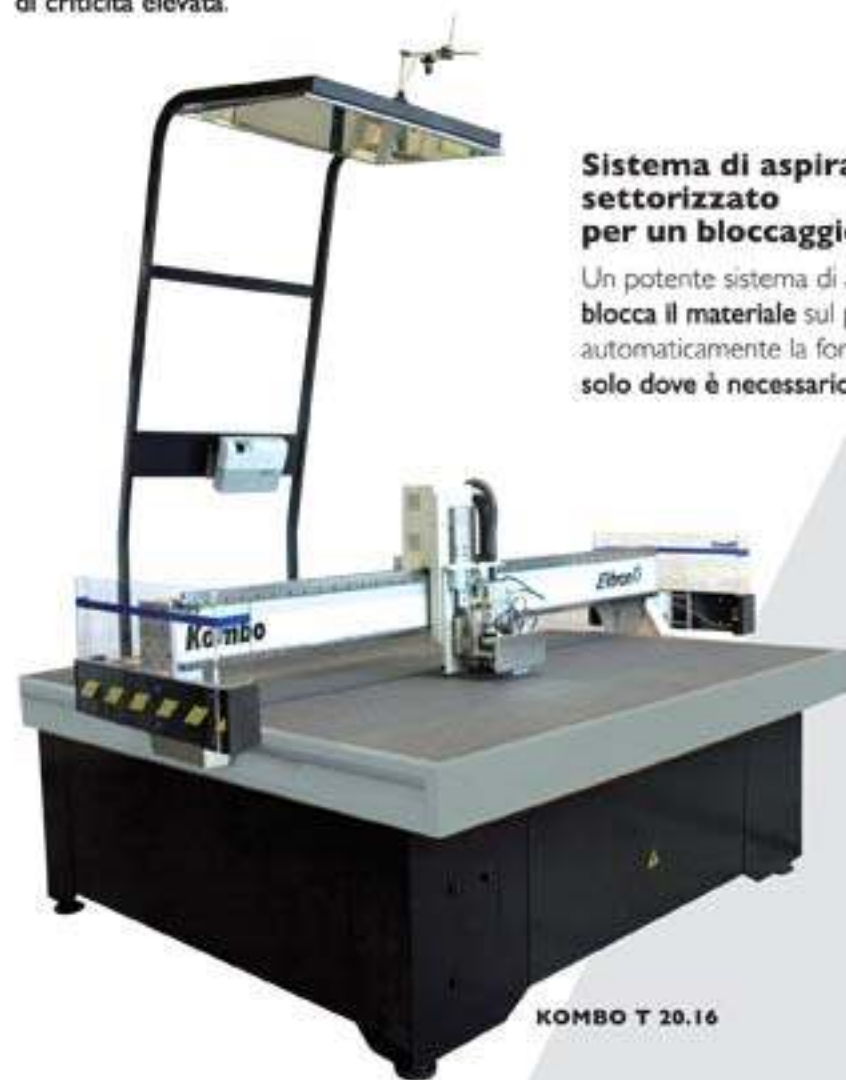
KOMBO T 20.16