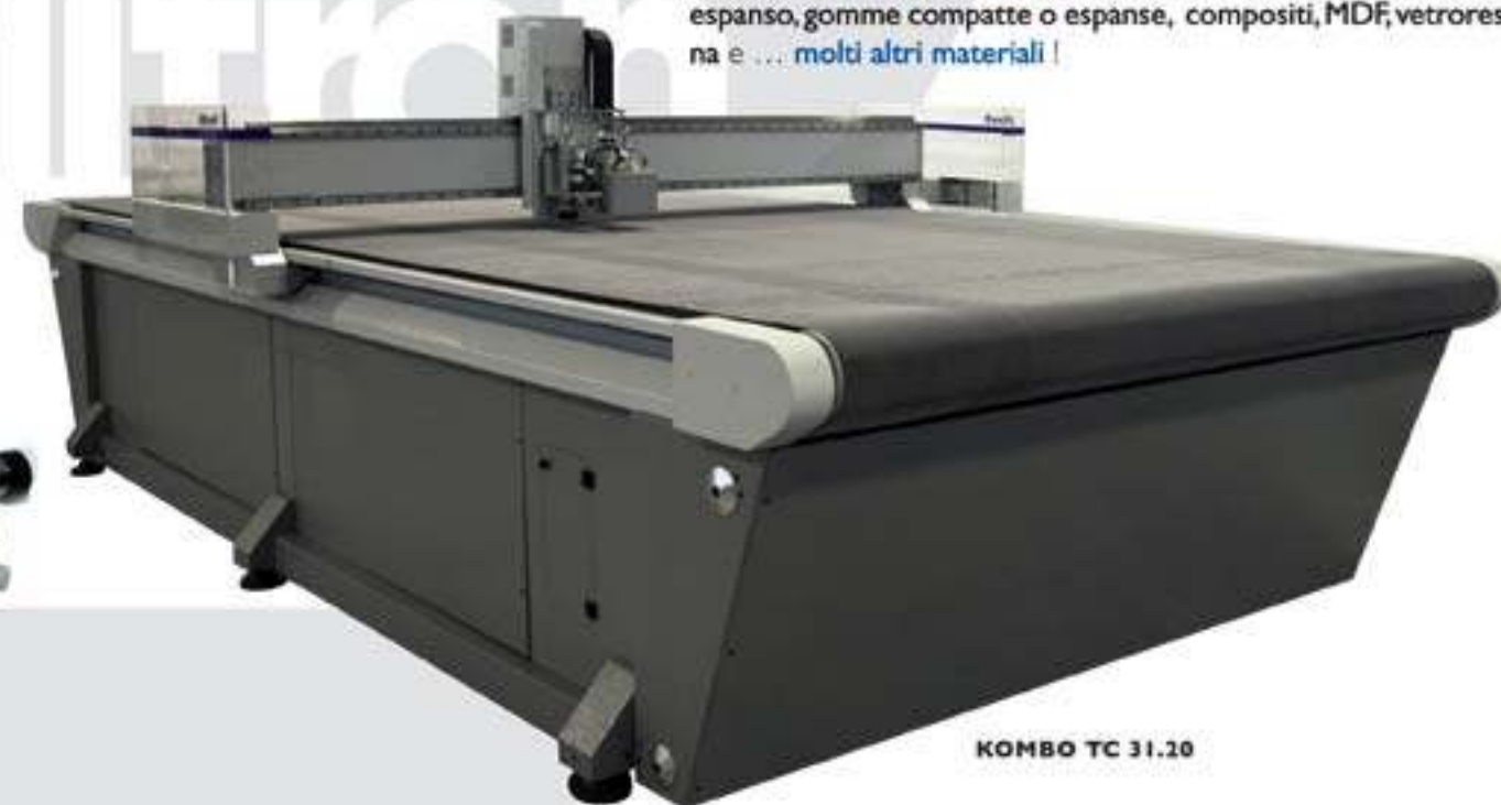
KOMBO TC 31.20